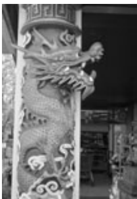
Gebäudedekoration am China-Restaurant, Vaihinger Straße 49

Vermutlich im Jahr 1983 anlässlich der Fertigstellung des zweiten Bauabschnitts am Königin-Charlotte-Gymnasium von der Stadt Stuttgart aufgestellt.